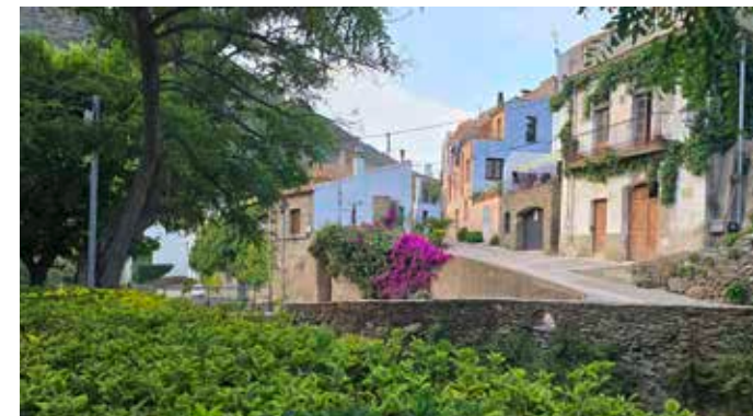
Callejuelas y rincones con encanto

Somos pequeños, pero nuestros rincones guardan sorpresas para todo aquel que nos quiera descubrir. Déjate perder por las callejuelas; en tu trayecto, irás encontrándote con los secretos que esconde nuestro patrimonio cultural y gastronómico