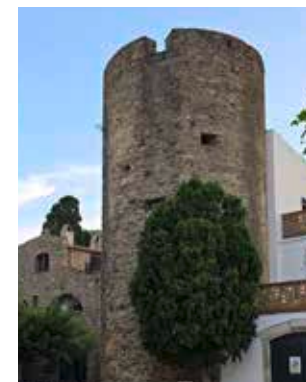
Torre de defensa del Camp de l'Obra