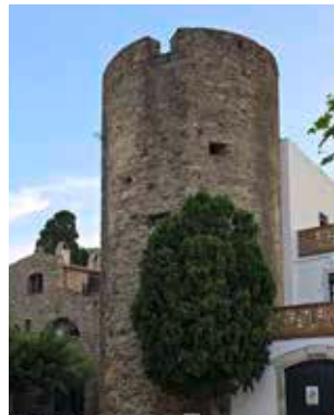
Torre de defensa del Camp de l'Obra