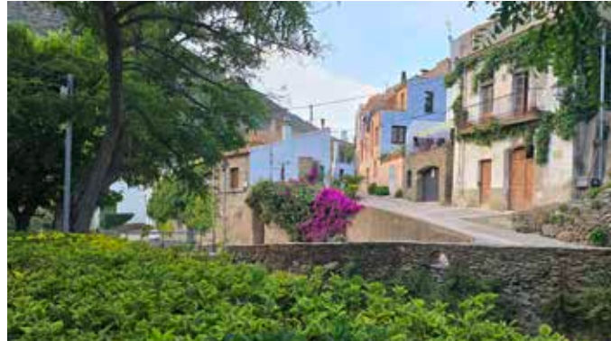
Carrerons i racons amb encant

Som petits, però els nostres racons guarden sorpreses per a tothom que ens vulgui descobrir. Deixa't perdre pels carrerons i en el teu camí aniràs trobant-te amb els tresors que amaga el nostre patrimoni cultural i gastronòmic.